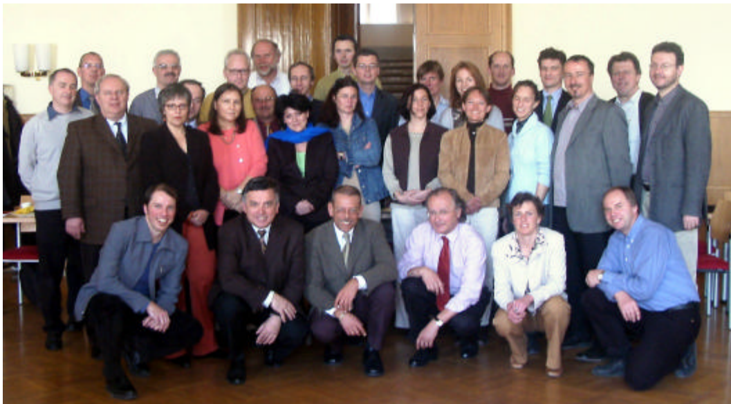
Fotounterschrift: Das Team der SUPer NOW