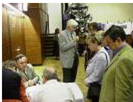
Fotounterschrift: Information der breiten Öffentlichkeit über die Zwischenergebnisse der SUPer NOW